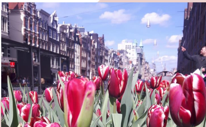
Paleiskwartiertulpen op het Damrak.

In totaal stonden er 111 schalen met tulpen op de Dam, mogelijk gemaakt door ondernemers en eigenaren uit het gebied. Samen vormden ze het woord 'Paleiskwartier'. Na deze schitterende dag hebben de schalen de gehele maand april in onze straten en op onze pleinen gestaan en gezorgd voor een fleurig welkom voor iedereen in het Paleiskwartier!