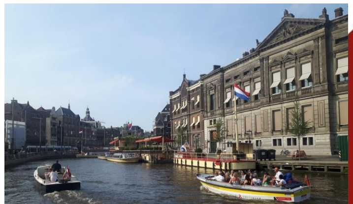
Het Rokin en de Oude Turfmarkt.

Op onze website en via social media zullen we regelmatig belevenissen en mooie initiatieven vermelden, volg ons en blijf op de hoogte van alle bijzonderheden in het Paleiskwartier!