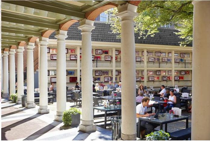
Een schitterende Parel in het Paleiskwartier, de binnenplaats van het Amsterdam Museum.