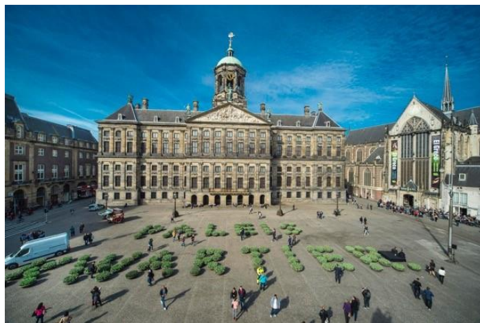
Lancering van het Paleiskwartier op de Dam.